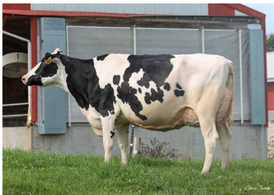
AOT DELUXE HI-LIGHTED GRANDDAM