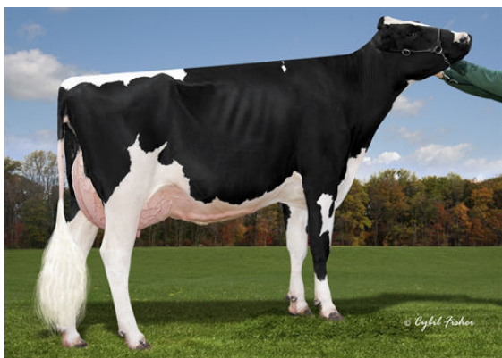
COOKIECUTTER DTA HABITAN FIFTH DAM